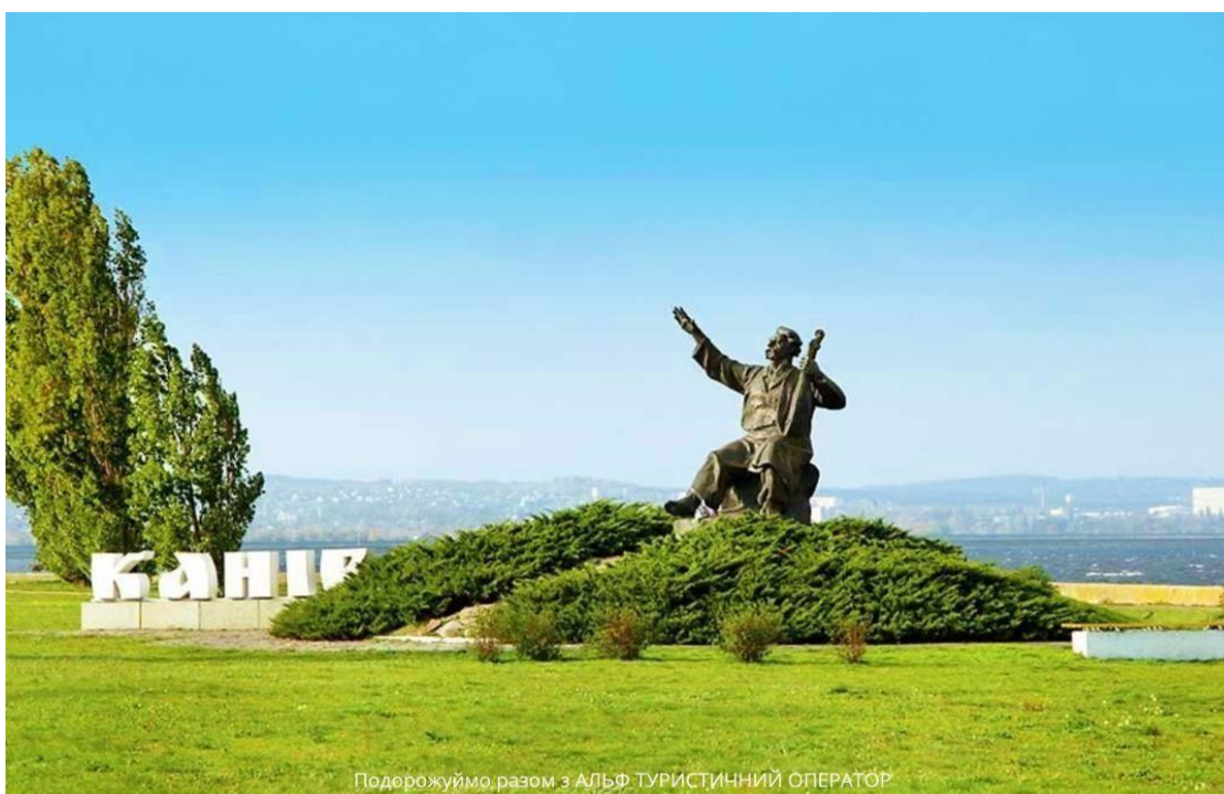
Подорожуймо разом з АЛЬФ ТУРИСТИЧНИЙ ОПЕРАТОР