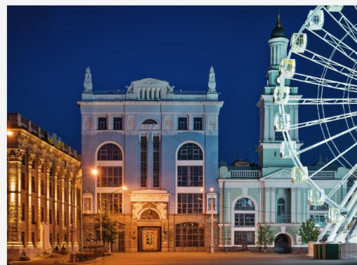
Альф туристичний оператор